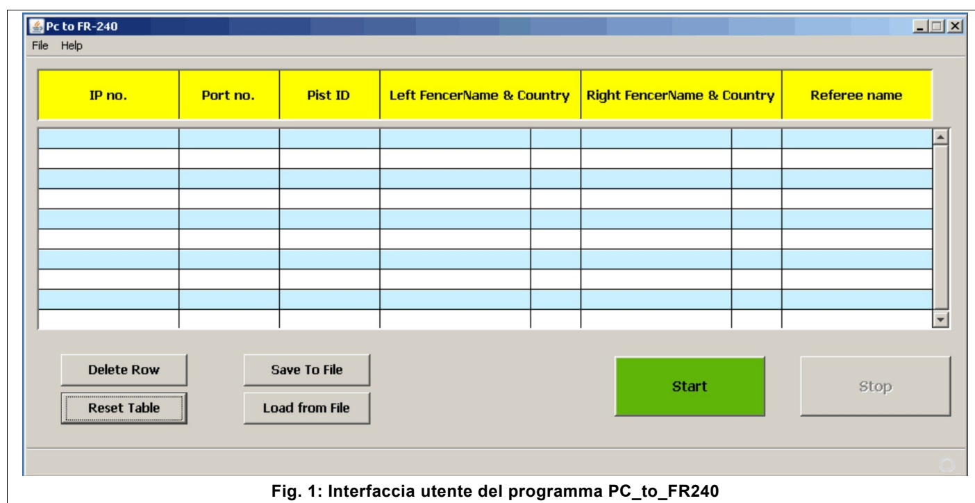
Fig. 1: Interfaccia utente del programma PC_to_FR240

Avviare il programma cliccando due volte in rapida successione con il mouse sopra il file “ PC_to_FR240.jar ”: verrà visualizzata la finestra grafica di Fig. 1.